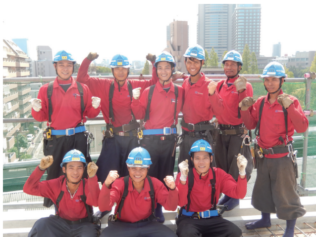
外国人研修生の施工現場での戦力化など人材不足の業界内でも注目される小泉組

大阪府をメインに京都、滋賀までのエリアで、中高層マンションを中心とした鉄筋加工と施工を手がける小泉組。マンション工事では基礎から柱筋・壁筋など最上階まで一括した配筋を行うほか、対象物件も木造住宅基礎から学校等の耐震補強工事までと幅広い。