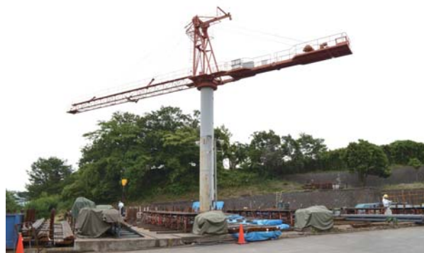
積算後の資材の調達・管理から、鉄筋加工までを一貫して行う、本社隣接のヤード

藤原氏：建築下請業の一つである当社の場合、一般の請負形態とは異なるのが特徴です。仕入れに対していくらかの利益を乗せて、自由にモノを売買する普通の企業とは違います。当社の場合、施工した鉄筋のトン当りの重量による出来高制です。たとえば積算何十トン・1000万円の受注の場合、ある月はその何分の一かの施工をする。そうしたら、その出来高を当月の請求とし、その出来高に応じた支払いを外注を含めた鉄筋工へ行うわけです。つまり、こうした請負形態を理解した上で業務をコンピューター化しなければいけないわけですから、80年代当時は相当時間がかかった記憶があります。