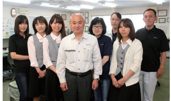
現在社員は19名。うち管理系の5名と現場監督6名が主に「アイキューブ本家シリーズ」を使用している。

まに作成できる帳票出力で現場と管理部門の間のチェックも確実になりました。特に自由帳票作成は、細かな条件設定ができる上によく使う設定はメモリ登録できるので大変便利です。まだまだ使いこなせていない機能も多いと思いますが、そんなときはアイキューブさんにすぐ電話をして確認します。サポート対応も丁寧なので大助かりですね。